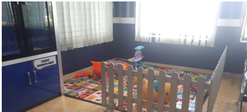
Ruang Bermain Anak