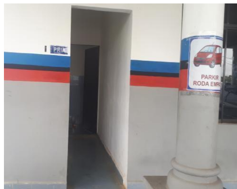
Kamar Mandi / WC